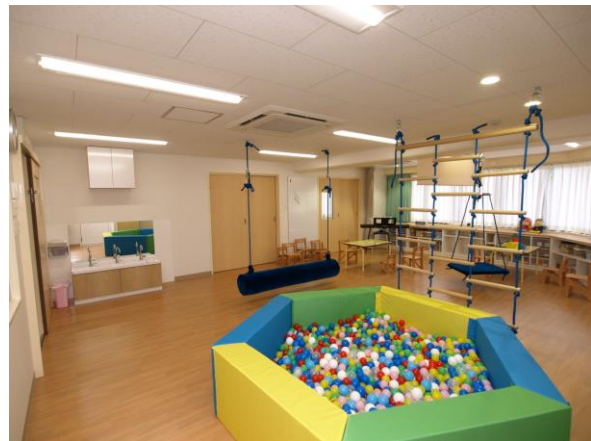
「アートチャイルドケア SED スクール近鉄学園前」教室

これまで保育所を数多く運営していく中で、発達について気になるお子様が観察されており、一部保育所では、発達障害と診断されたお子様に対して、保育士の加配や専門要員が巡回するなどにより、保育の観点から、気になるお子様への環境づくりを実施してまいりました。